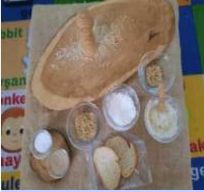
EKMEK KONUSUNU ELE ALDIK VE EKMEĞİN YOLCULUĞUNU ÖĞRENİRKEN BUĞDAYLARI ELDE ÖĞÜTMEME ÇALIŞTIK