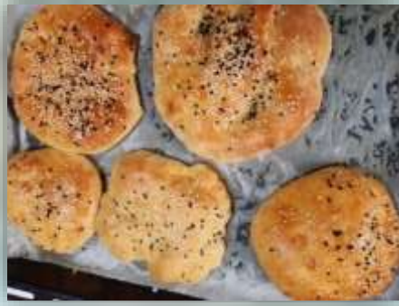
MİS GİBİ KOKAN RAMAZAN PİDESİ YAPTIK