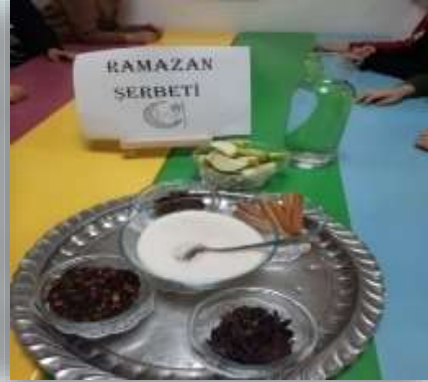
TADINA DOYAMADIĞIMIZ RAMAZAN ŞERBETİ KAYNATTIK