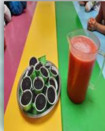
TAZE MEYVELERDEN HAZIRLADIĞIMIZ ÇİLEKLİ LİMONATA HAZIRLADIK VE AFİYETLE İÇTİK