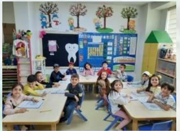
OKUMA YAZMAYA HAZIRLIK ETKİNLİKLERİMİZİ YAPTIK