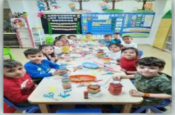
ÇEŞİTLİ OYUNLAR OYNADIK