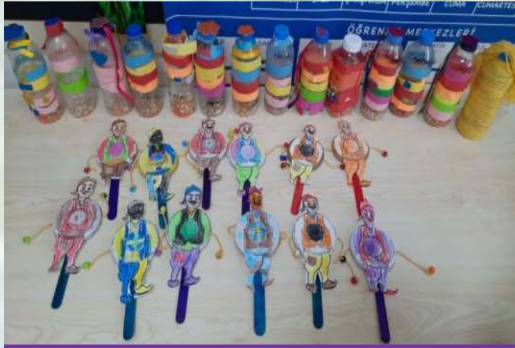
RİTİM ARAÇLARINDAN MARAKAS VE MİNİ DAVUL (TAM-TAM) YAPTIK